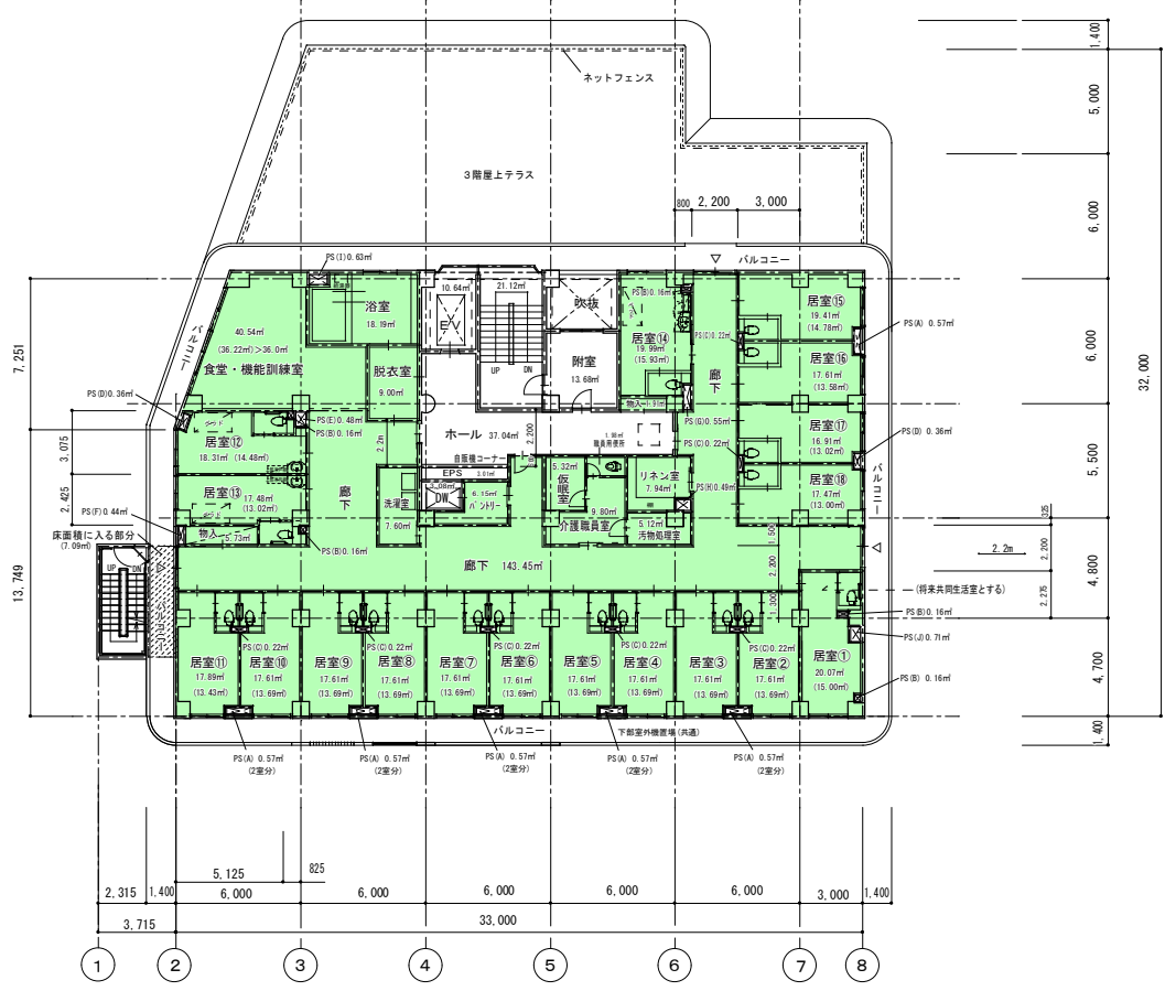
住宅型有料老人ホーム①(個室型) 4階平面図 1:200 住宅型有料老人ホーム②(個室型) (居室有効面積 13.00㎡以上必要)